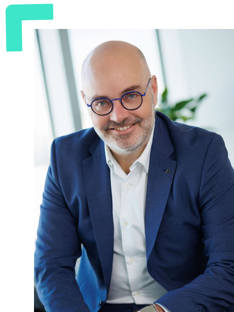
Damien Charrier Président du Conseil national de l'ordre des experts-comptables