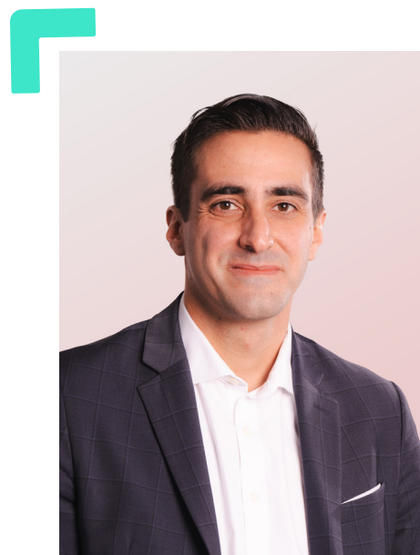
Gilles Bösigler Président du Conseil régional de l'ordre des experts-comptables de Paris Île-de-France